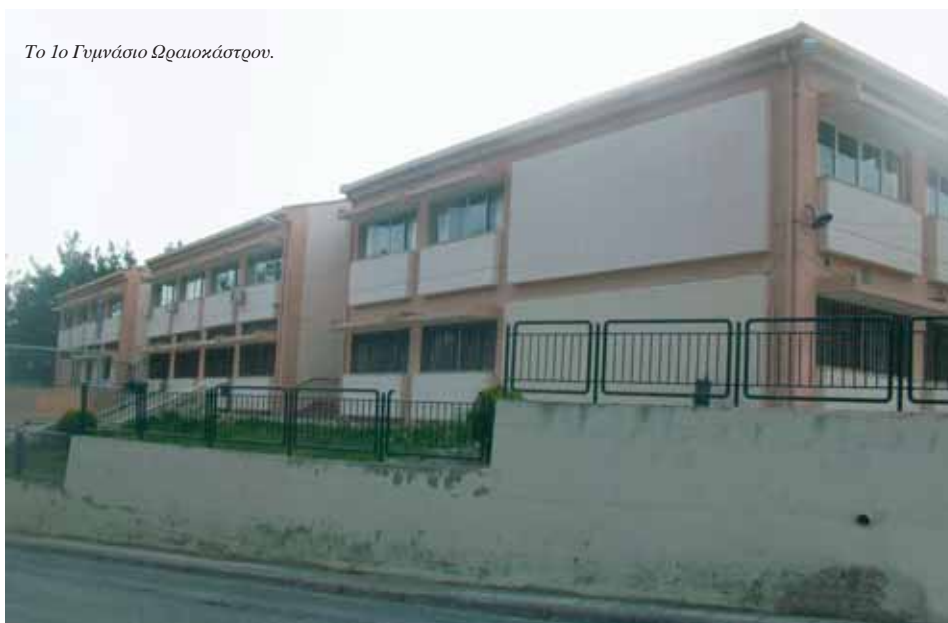
Το 1ο Γυμνάσιο Ωραιοκάστρου.

Στην παρούσα μελέτη, που στηρίχθηκε κυρίως στα αρχεία του Δήμου Ωραιοκάστρου, ο συγγραφέας εξοικειώθηκε αναγκαστικά με τους παλαιότερους κατοίκους που δεν υπάρχουν πια. Καθώς τα ονόματα των σύγχρονων δημοτικών αρχόντων απλώνονται στο χαρτί, ο ερευνητής μπορεί πια με ευχέρεια να διακρίνει τους απογόνους των παλαιών κατοίκων ανάμεσα στους νεότερους. Γνωρίζει τις τριβές και τις εντάσεις των παλαιότερων, είτε τις αφηγήθηκε είτε όχι. Τριβές και εντάσεις που οφείλονταν σε διαφορές για βοσκοτόπια, για αγρούς, για καλλιέργειες, σε αδιζίες που πυροδότησαν διακρίσεις, αντιπαλότητες