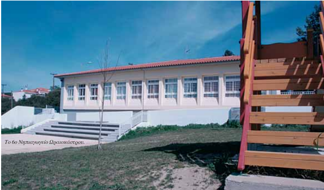
Το 6ο Νηπιαγωγείο Ωραιοκάστρου.

στον κοινωνικό ιστό του Ωραιοκάστρου και την αξιοποίησή τους για τις αυξανόμενες εκπαιδευτικές και κοινωνικές ανάγκες των δημοτών. Δυσανάλογη προς τη σημασία τους ήταν επίσης η περιορισμένη αναφορά μας στις τεχνικές σχολές του ΟΑΕΔ, ενώ δεν αναφερθήκαμε σε παραμέτρους όπως η έντονη τραπεζική παρουσία στο Ωραιοκάστρο (με επτά καταστήματα) και η εγκατάσταση αυτόματου κέντρου διαλογής των Ελληνικών Ταχυδρομείων.