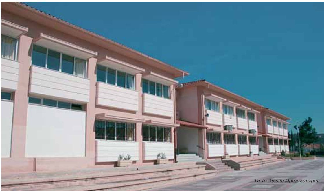
Το 1ο Λύκειο Θεσσαλονίκης.

Υπάρχουν και άλλα ζητήματα μετασχηματισμού, στα οποία δεν επιμείναμε και περιμένουν τον μελλοντικό ερευνητή. Τέτοιο θέμα είναι η Παιδόπολη Άγιος Δημήτριος , η οποία αποτέλεσε ίδρυμα εσωτερικής φροντίδας, για παιδιά που είχαν ανάγκη από προστασία. Στη διάρκεια του εμφύλιου πολέμου 15.000 παιδιά από κοινότητες που ενεπλάκησαν άμεσα σε αυτόν συγκεντρώθηκαν σε 54 παιδοπόλεις. Υπό τις χαλεπές συνθήκες της εποχής στα παιδιά αυτά εξασφαλίστηκε επαρκής τροφή (η πλειονότητα των παιδιών στην Ελλάδα δεν είχε εξασφαλισμένο καθημερινό σιτηρέσιο 2.700 θερμίδων που δινόταν στις παιδοπόλεις), ένδυση, μόρφωση και επαγγελματική άσκηση, καθώς και ιατρική παρακολούθηση. Τα χρήματα συγκεντρώνονταν με ερόνους