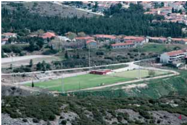
4. Διαμόρφωση του χώρου του δημοτικού γηπέδου.