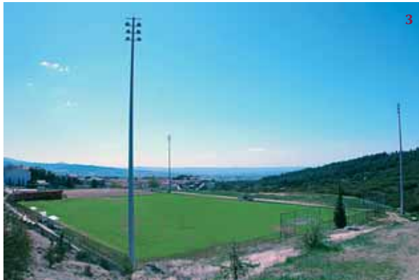
3. Το δημοτικό γήπεδο.

Στην περίοδο 1999-2002 πραγματοποιήθηκε το πρό-