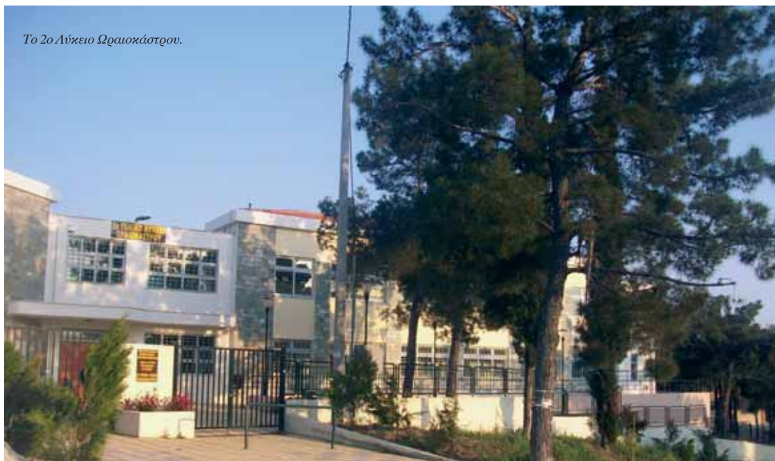
Το 2ο Λύκειο Ωραιοκάστρου.

κο 30 στρεμμάτων, καλυμμένο με γρασίδι και με δενδροφυτεμένο το βόρειο τμήμα του.