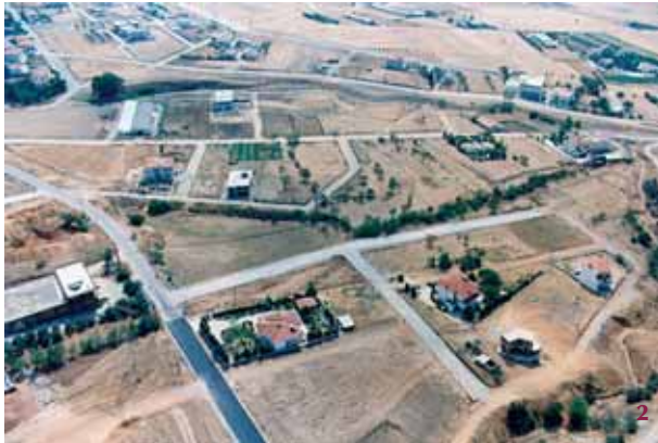
2. Διάνοξη οδών για την επέκταση του σχεδίου. Ασφαλτόστρωση της οδού προς Νεοχωρούδα.

δωση δρόμων στις περιοχές επέκτασης και οι ασφαλτοστρώσεις παλαιών και νέων δρόμων που πραγματοποιήθηκαν από το 1999 ως το 2002 απαιτήσαν 1.500 εκατομμύρια δραχμές (βλ. Πίνακα 24). Ποσοστό 62% αυτού του ποσού προήλθε από ίδιους πόρους του Δήμου, ποσοστό 13% από δανειοδότηση από το Δημόσιο και το υπόλοιπο 25% από ευρωπαϊκά προγράμματα ή δημόσιους φορείς.