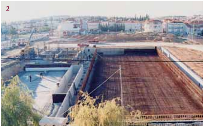
2. Η κατασκευή του Δημοτικού Κολυμβητηρίου Ωραιοκάστρου. Λήψη 2004.