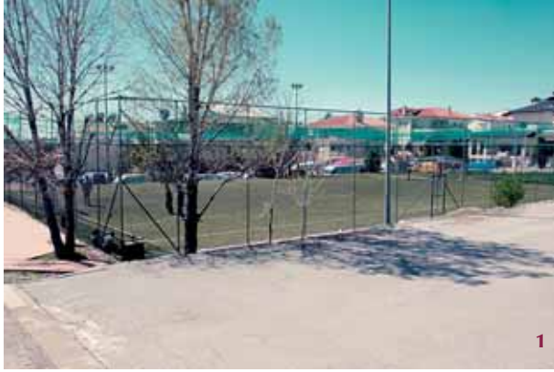
1. Μικρά γήπεδα ποδοσφαίρου (5x5) για την εξάσκηση των νέων στο Δημοτικό Γυμναστήριο.