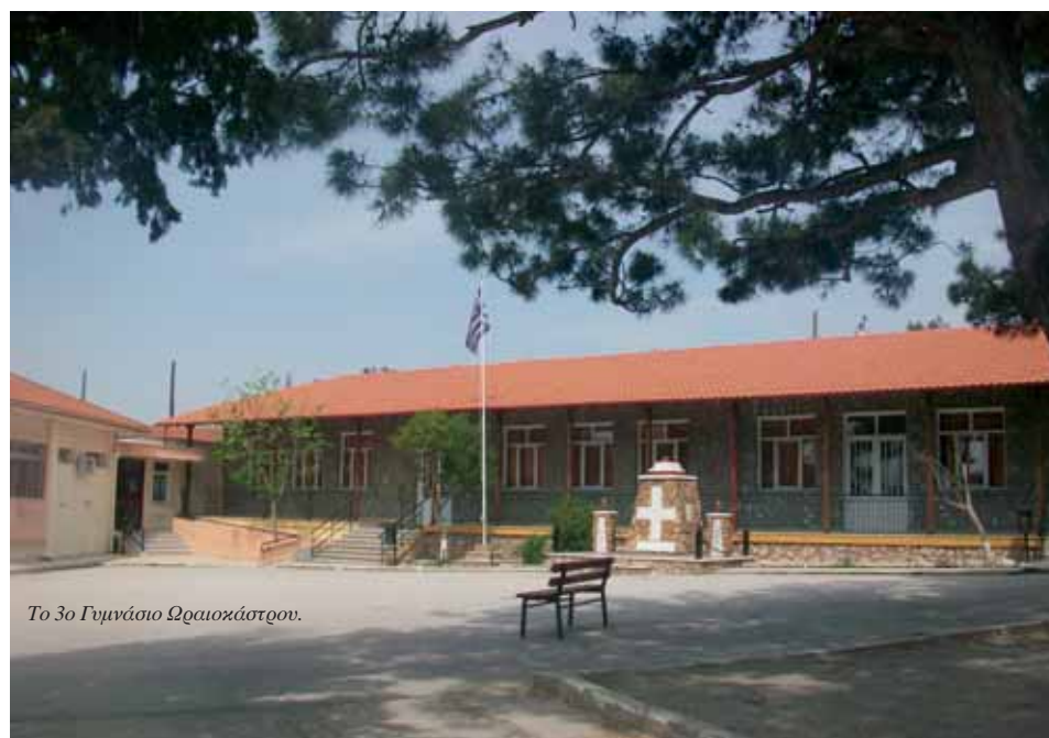
Το 3ο Γυμνάσιο Ωραιόκαστρον.

Το 2011 συμπληρώνονται 150 χρόνια από τότε που έχουμε την πρώτη είδηση για τον νεότερο οικισμό του Νταούντ Μπαλί και