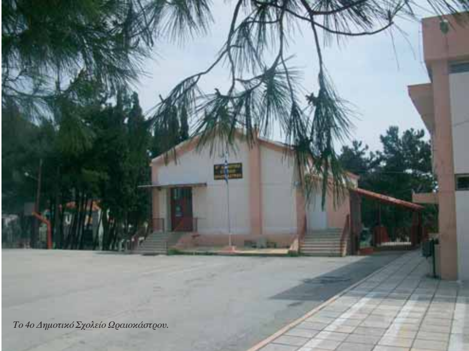
Το 4ο Δημοτικό Σχολείο Ωραιοκάστρου.

85 χρόνια από την ίδρυση της Κοινότητας Ωραιοκάστρου. Με κατάληξη τη σημερινή διοίκηση του Δήμου, πολλοί μόχθησαν για τον πληθυσμό αυτού του τόπου, ο οποίος ξεκίνησε ως μικρός και αραϊός οικισμός και κατέληξε σε σύγχρονη πόλη. Τώρα, όμως, στο τέλος πια της αφήγησης, ο συγγραφέας δεν μπορεί να μη θαυμάσει τον ευφυή εκείνο Ωραιοκαστρίτη –όποιος και αν ήταν– ο οποίος επέλεξε τον θρύλο του Ωραιού Κάστρου, τον θρύλο της περιγίππισσας του Πόντου, που πέθανε πολεμώντας