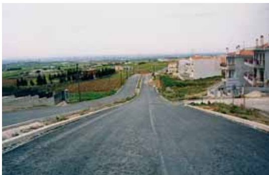
Ο περιφερειακός οδικός άξονας, που έλαβε την ονομασία οδός Χρυσάνθης Κονταξοπούλου, έχει πλάτος 20 μέτρων. Τις λωρίδες εισόδου και εξόδου χωρίζει νησίδα πλάτους ενός μέτρου. Συνδέει τους οικισμούς και χωρίζει την οικιστική από την υπό ένταξη περιοχή.