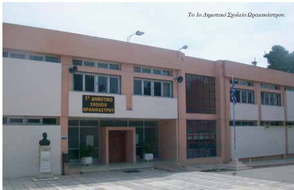
Το 1ο Δημοτικό Σχολείο Ωραιοκάστρου.

αρχής για την εξάλειψη της γεωγραφικής ασυνέχειας ανάμεσα στις πολεοδομικές ενότητες του Ωραιοκάστρου, με την ένταξη νέων περιοχών στο σχέδιο. Ή τις προσπάθειες να χωροθετηθεί και να ρυμοτομηθεί το Βιοτεχνικό Πάρκο, ώστε να δημιουργηθούν υποδομές και οδικά δίκτυα και να παραμείνουν στην περιοχή οι πεντακόσιες επιχειρήσεις που λειτουργούν σε αυτό. Ή την κατασκευή ενός ανοιχτού θεάτρου 700 θέσεων στον χώρο του παλαιού λατομείου, στον παλαιό βοσκότοπο Asia Μπουργκάς . Είναι, άλλωστε, ένα έργο σημαντικό όχι μόνο για το Ωραιοκάστρο αλλά και για το σύνολο του πολεοδομικού συγκροτήματος Θεσσαλονίκης. Δεν μπορεί να αγνοηθεί το γεγονός ότι ο παλιός αλωνότοπος μετασηματίστηκε σε εντυπωσιακό πά-