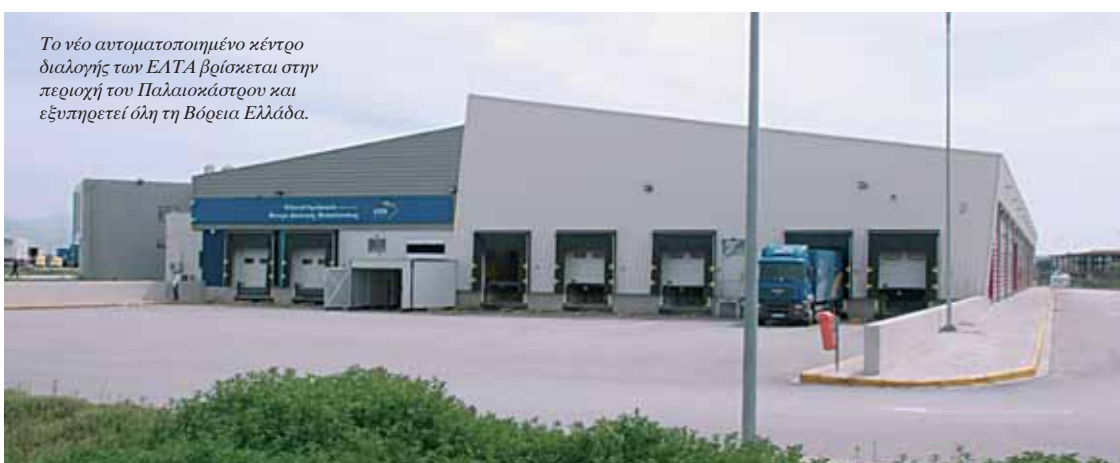
Το νέο αυτοματοποιημένο κέντρο διαλογής των ΕΑΤΑ βρίσκεται στην περιοχή του Παλαιοκάστρου και εξυπηρετεί όλη τη Βόρεια Ελλάδα.

της Προνοίας Βορείων Επαρχιών 6 . Η παιδόπολη Άγιος Δημήτριος στο Ωραιόκαστρο εγκαινιάστηκε με τη δέουσα μεγαλοπρέπεια από τη βασίλισσα Φρειδερίκη, που επισκέφθηκε για τον λόγο αυτόν τη Θεσσαλονίκη, στις 10 Φεβρουαρίου 1959 7 . Στην παιδόπολη αυτήν προωθούνταν τα παιδιά που μπορούσαν να σπουδάσουν, με τον όρο όμως να προάγονταν σε κάθε τάξη με βαθμό δεκαεφτά και μισό τουλάχιστον, και όχι δεκαεφτά 8 . Η ανάγκη του ιδρύματος αυτού –όπως και των παρόμοιων ιδρυμάτων, που κάποτε υπήρξαν απαραίτητα, όπως διαβεβαιώνουν οι πρώην τροφομοί τους 9 – σταδιακά εξέλιπε. Τα τελευταία χρόνια ο Δήμος Ωραιόκαστρου καταβάλλει συστηματικές και αποτελεσματικές προσπάθειες για τη βαθμιαία ένταξη των χώρων του ιδρύματος