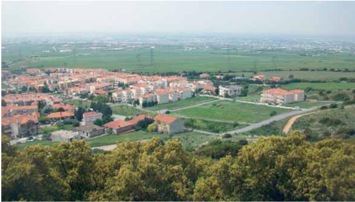
Τα τελευταία σπλίτια του υπάρχοντος οικισμού και ο κενός χώρος εφαρμογής του νέου σχεδίου.