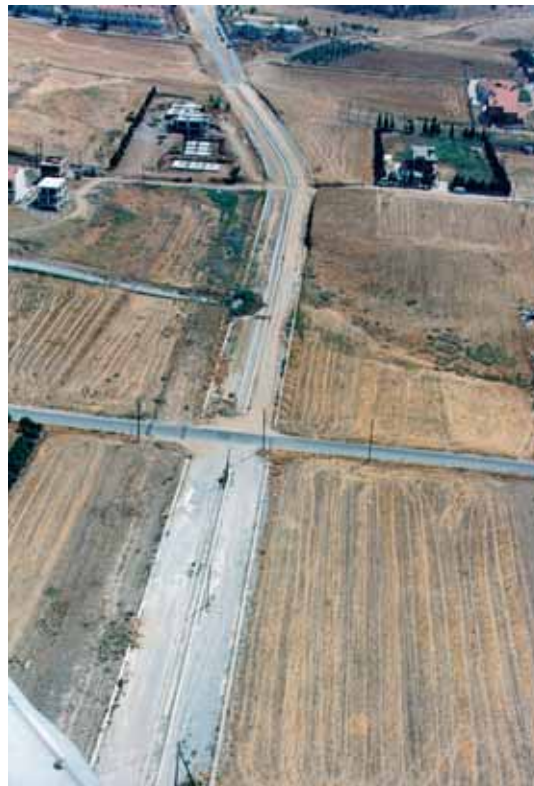
Η οδός Μακεδονικού Αγώνα στη συμβολή της με την οδό Κονταξοπούλου. Λήψη 1998.