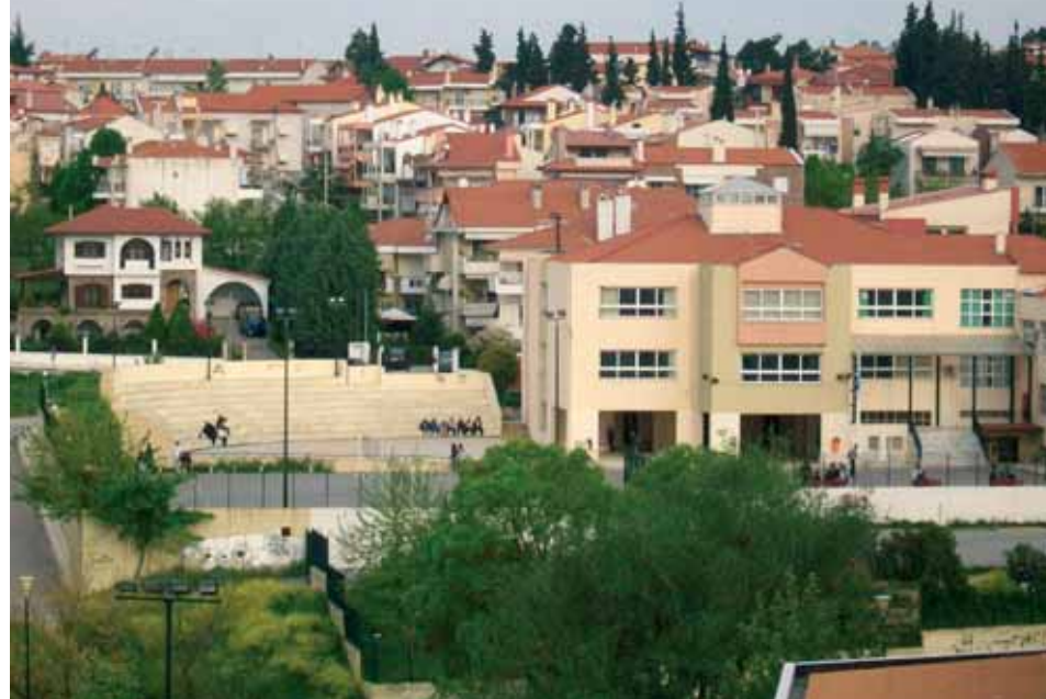
Το 2ο Γυμνάσιο Ωραιόκαστρον.

Σήμερα στο Ωραιόκαστρο λειτουργούν οκτώ νηπιαγωγεία, έξι δημοτικά σχολεία, τρία γυμνάσια, δύο λύκεια, ενώ έχει προγραμματιστεί και υλοποιείται η κατασκευή νέων σχολικών συγκροτημάτων. Λειτουργούν επίσης τρεις δημοτικοί βρεφονηπιακοί-παιδικοί σταθμοί και ένα Κέντρο Δημιουργικής Απασχόλησης Παιδιών (με απογευματινό ωράριο).