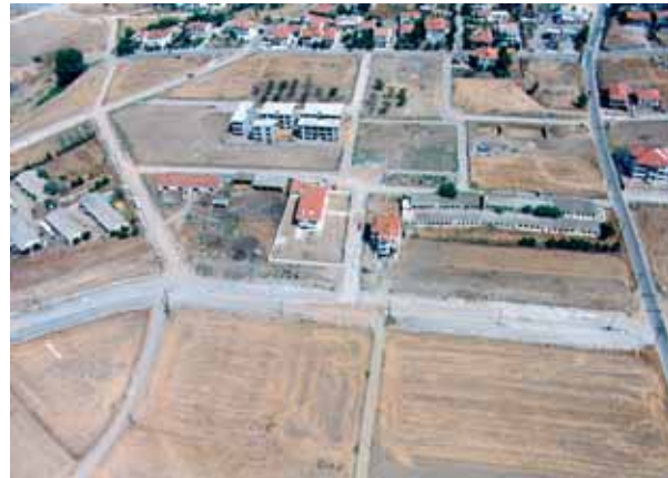
Πίνακας 24. Διάνοιξη και κρασπέδωση δρόμων περιοχών επέκτασης και ασφαλτοστρώσεις