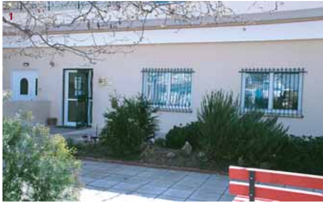
1. Το ιατρείο του ΙΚΑ Ωραιοκάστρου.