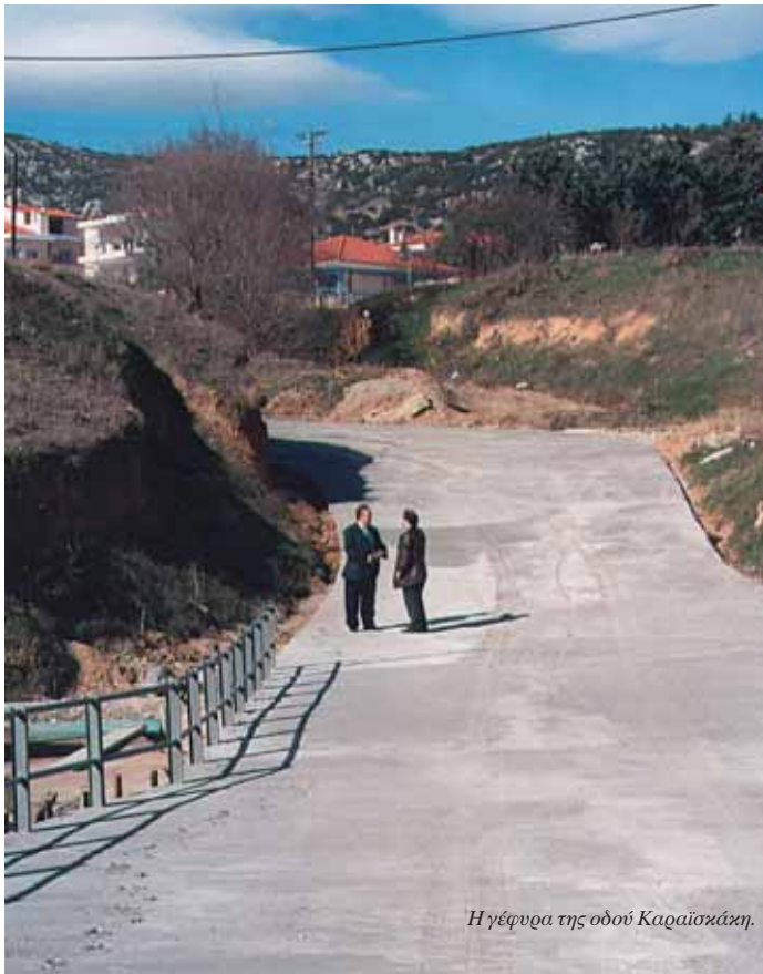
Η γέφυρα της οδού Καραϊσκάκη.

ντρο αυτό τοποθετήθηκε κοντά στο Ωραιόκαστρο το 1972, με εξοπλισμό που αποκτήθηκε από την (τότε) Λαϊκή Δημοκρατία της Γερμανίας 5 . Ο Δήμος διεκδικεί να γίνουν υπόγειες όσες γραμμές θα παραμείνουν μετά τη μεταφορά του Κέντρου στην Άσσηρο.