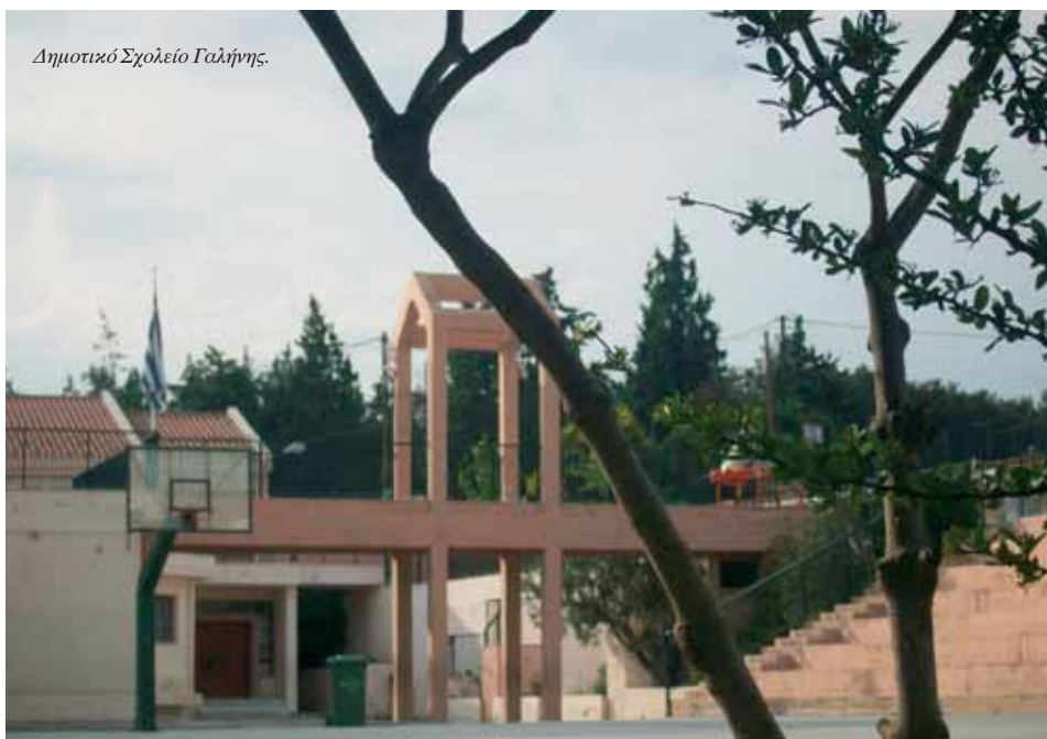
Δημοτικό Σχολείο Γαλήνης.

τον εχθρό. Αν ήταν απαραίτητος ο θρύλος στα δύσκολα εκείνα χρόνια, φάνηκε σε αυτήν την εξιστόρηση. Σήμερα, όλοι γνωρίζουν ότι το Ωραιο Κάστρο δε βρίσκεται πια στον Πόντο. Μπορούμε, όμως, να το αναζητήσουμε στη σκιά του Σεβρί τέπε, του βουνού χωρίς όνομα, που πριν από μερικούς αιώνες το ονόμαζαν Καραντάγ . Ο θρύλος εκπλήρωσε τον προορισμό του. Η περιγίππισσα νίκησε τους εχθρούς και το Ωραιοκάστρο έγινε μια όμορφη πόλη.